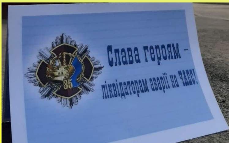
Листівки, які отримали ліквідатори та їхні родини, які живуть в нашому районі

Щороку, 26 квітня, весь світ згадує і вшановує пам'ять про загиблих. І ми, учні та вчителі ХЗОШ №53, згадуємо харків'ян-ліквідаторів, їхніх вдов, родини та висловлюємо щире подяку таким героїчним людям. Адже вони врятували життя мільйонів, вони врятували нашу планету!