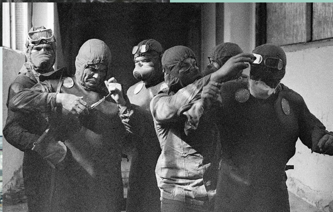
Архівні фото ліквідаторів

Через 35 років після аварії, з огляду на відсутність людей, на цій території утворився умовний заповідник. В чорнобильській зоні знайшла притулок безліч видів тварин та птахів, серед яких все частіше можна зустріти рідкісні види. І хоч територія ще не зовсім безпечна для постійного проживання, поодинокі люди починають на ній заселятися.