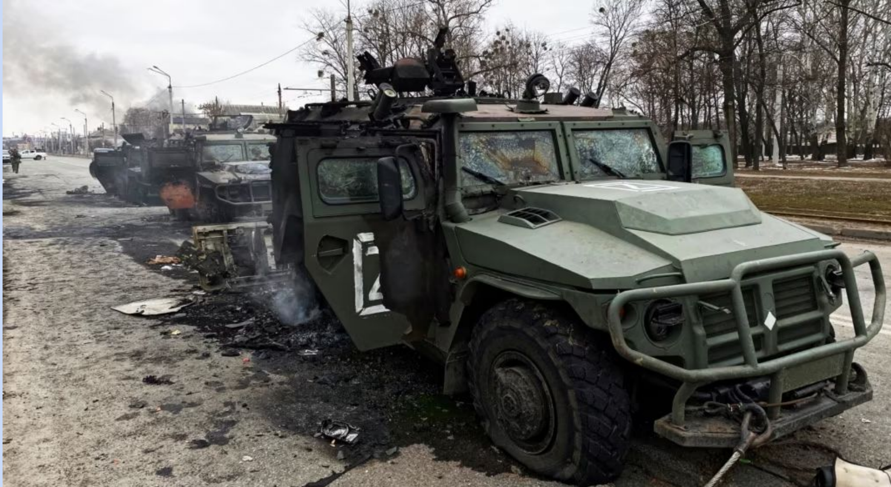
Знищені бронеавтомобілі високої прохідності російської армії «Тигр-М» на дорозі в Харкові, 28 лютого 2022 року