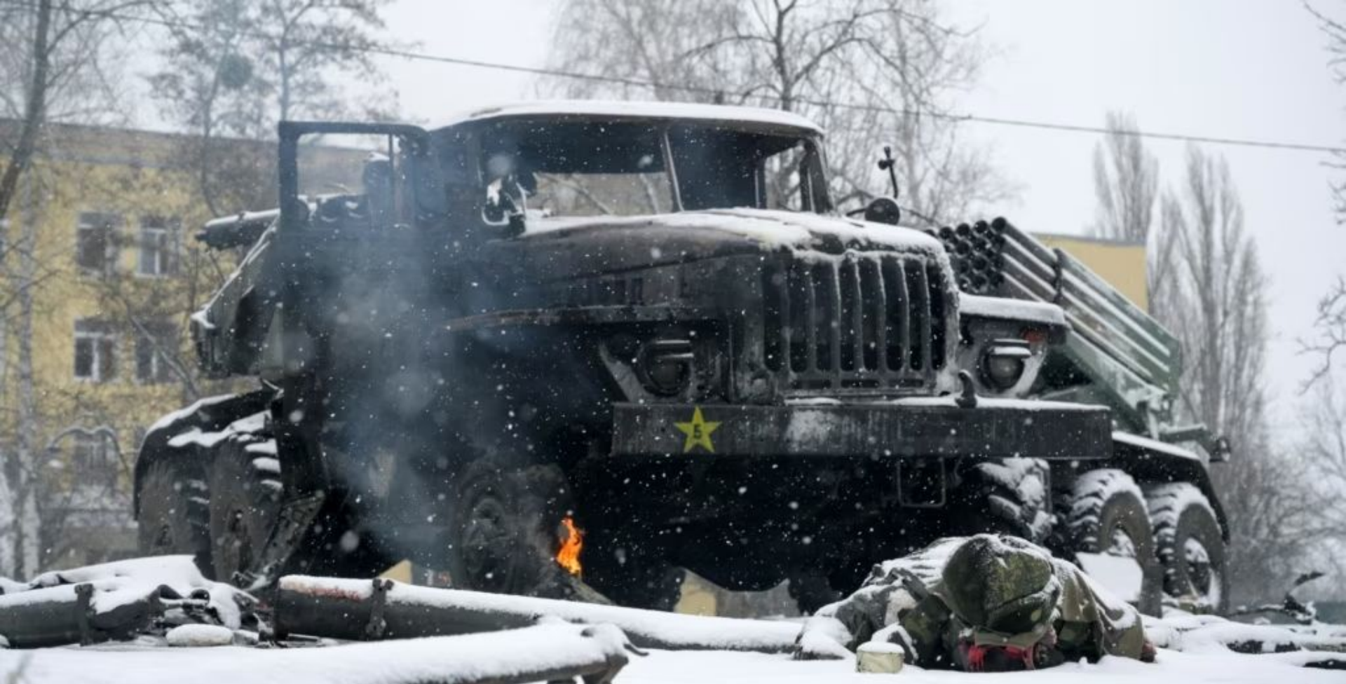
Знищені реактивні системи залпового вогню російської армії на околицях Харкова, 25 лютого 2022 року