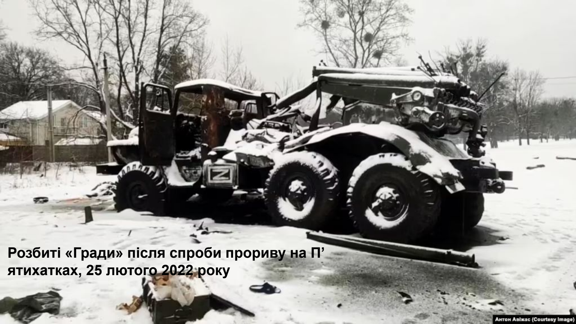
Розбиті «Гради» після спроби прориву на П'ятихатках, 25 лютого 2022 року