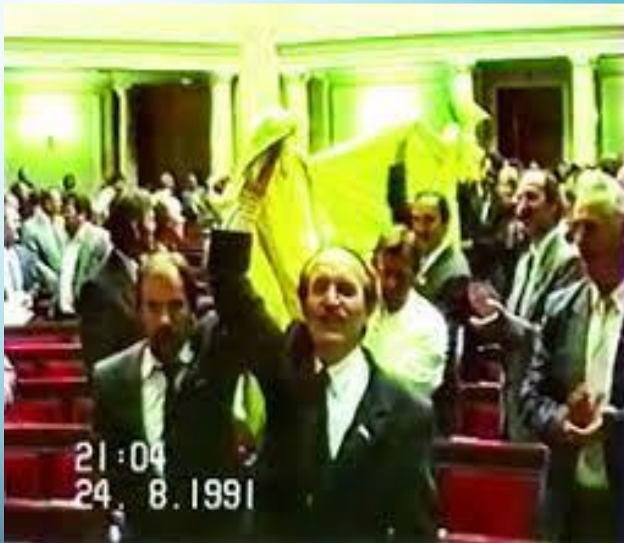
Фото: 24.08.1991 р. - проголошення незалежності України.

Тиск посилювався з приходом до влади там колишнього співробітника репресивного органу КГБ Володимира Путіна.