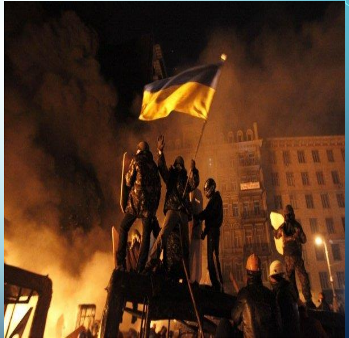
Фото: активісти Євромайдану.

Трагічною ціною протистояння на Майдані стала загибель 107 героїв – Небесної Сотні –, різних за віком, статтю, освітою, з різних куточків України. Наляканий Віктор Янукович втік до Росії, звідки закликав володимира путіна здійснити військове вторгнення в Україну для відновлення його влади.