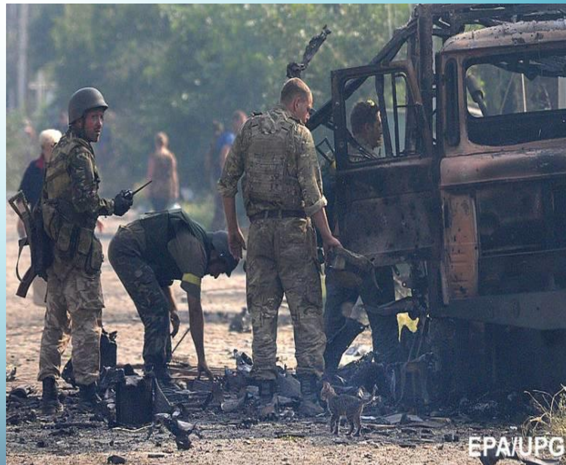
Фото: знищена техніка ворога.

Після проголошення так званих “народних республік” на Донеччину та Луганщину безперешкодно і масово прибували не тільки загони російських диверсантів, а й військова техніка зі зброєю. Проте план на повторення швидкого “кримського сценарію” дав збій. Боездатні частини Збройних Сил України, Національної гвардії і добровольчі формування зламали намір агресора. Протягом літа 2014 року російські гібридні сили на сході України зазнавали значних втрат в особовому складі, озброєнні, військовій техніці. Але їх постійно посилювали новими найманцями, військовослужбовцями регулярних ЗС РФ.