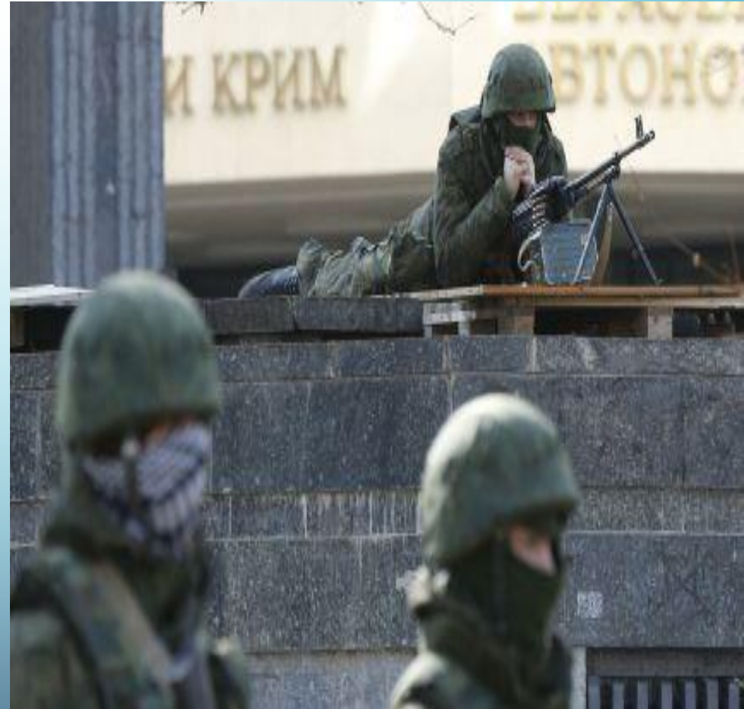
Фото: російські солдати в окупованому Сімферополі.

Факт незаконної анексії визнали і міжнародні суди, зокрема, Європейський суд з прав людини підтвердив, що РФ встановила контроль над Кримом з 27 лютого 2014 року.